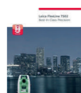
FlexLine TS02 Брошюра

Иллюстрации, описания и технические характеристики не приложены. Все права защищены. Отпечатано в Швейцарии. Copyright Leica Geosystems AG, Херрбругг, Швейцария, 2012 789503en - IV.12 - RDV