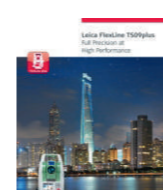
FlexLine TS09plus Брошюра