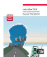
Viva TS11 Брошюра