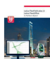
FlexField plus и FlexOffice Брошюра